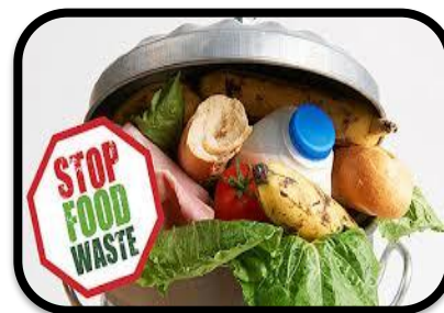
食物，水和营养物质