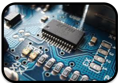
电子和信息技术产品